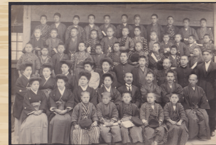
大正元年(明治45年) 今より112年前の島原湊尋常高等小学校第一回卒業生の写真