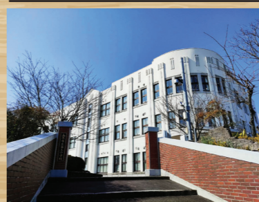
平成24年 現在の新校舎完成

平成24年8月 前年の夏休みから行われていた 建替え工事が終わり新校舎が完 成しました。完成した新校舎は それまでの校舎の面影を残しつ つ、校舎内部は木の温かみのある 優しい雰囲気作りとなり、 この年の2学期から子ども達の 新たな学び舎としての歴史を スタートさせました。