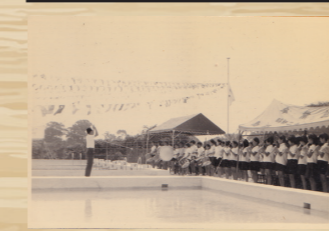
昭和47年 プール完成(落成式の写真)

写真から現在のプールの位置あたりに土俵があるのが伺えます。行司の方や土俵の水引幕を見ると本格的な相撲大会だった事がわかります。とても盛り上がっている様です。