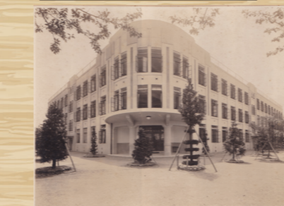
昭和3年 新校舎完成

昭和3年 鉄筋コンクリート造の3階建て 校舎が完成しました。大戦中の 空爆を避けるため壁は黒く塗り つぶされたそうです。老朽化と ともに耐震性が低くなっていた 為83年の歴史に幕を降ろしまし た。