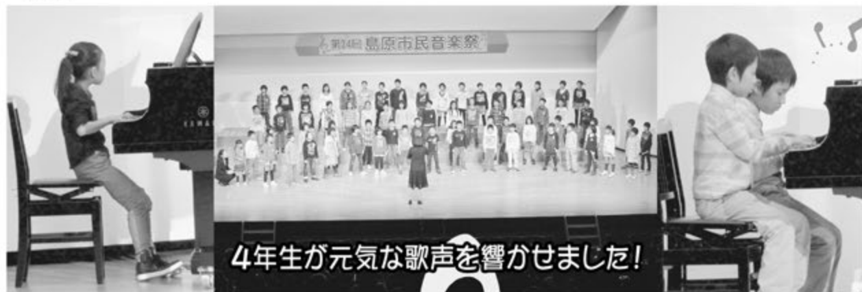
4年生が元気な歌声を響かせました!