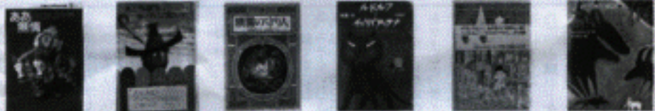
ああ無情 大どろぼう ホッツェンプロッツ シリーズ 守り人 ルドルフとイッパイアッテナ モモ あらしのよるに