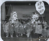
おみこしわっしょい!

二年生の生活科の学習で、六月にさつまいもの苗を植え、みんな育ててきました。そして、11月21日(金)いつもお世話になっているお散歩パトロールの方々に、一年生、保護者のみなさんを招待して「おいも祭り」をしました。二年生の子どもたちは、おみこしをついたり、合奏や群読等を発表したりしました。また、出店を開いて、ゲームを楽しんでもらったり、手作りの品々を買ってもらったりして大喜びでした。