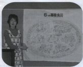
食に関する勉強会