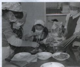
親子で、なかよく調理