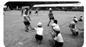
3年生 わんぱくハリケーン