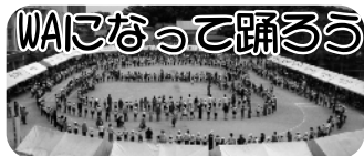
子どもクラブ対抗リレー