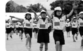
1・2年生 手のひらを太陽に