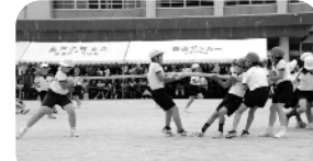
4年生 栄光の棒引き