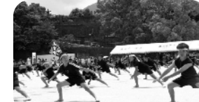
3・4年生 よさこいソーラン