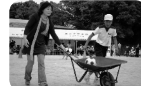
6年生 家族ふれあいの日