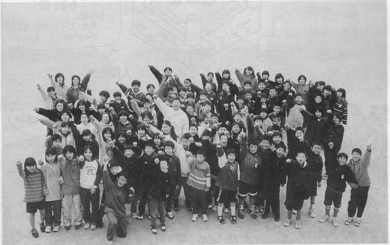
平成13年3月ガッツ・GUT'S!! 卒業生