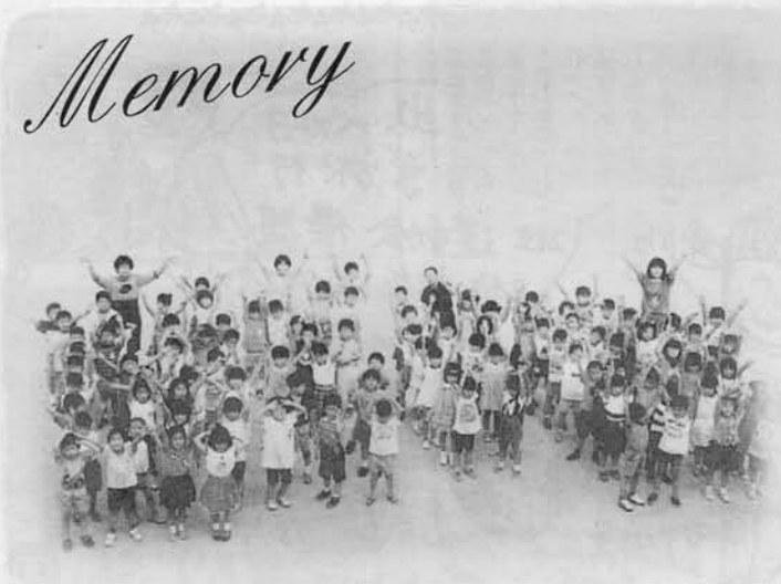
平成7年4月・ピカピカの一年生