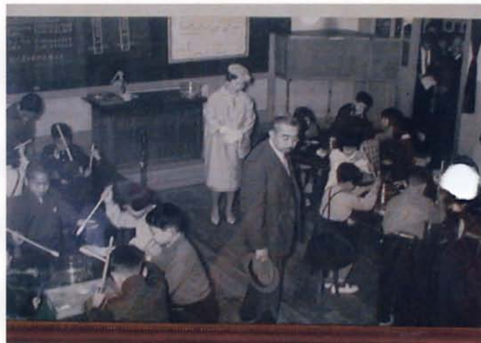
理科室御視察風景

島原第三小学校は昭和34年、第一次ソニー小学校理科教育振興資金計画に参加した結果、みごとに優秀校として、理科振興資金100万円を受賞して「私たちの科学館」を整備しました。