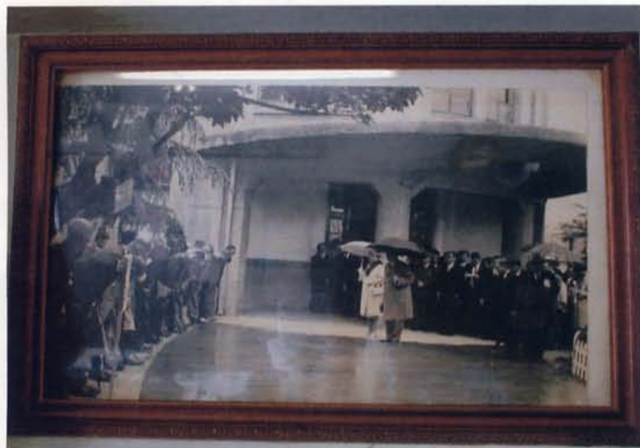
三小正面玄関前でのお出迎え