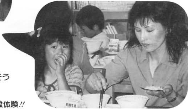
どれどれ、ウーン、なかなかおいしそう