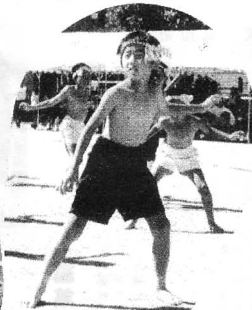
きまった！このポーズ、 ヤーレンソーラン節

・小さい子供たちがとても可愛かった。全員リレーというのは初めて見ました。父兄による田吾作はその辺のまつりより面白かったし、またお父さんやお母さんの愛情を感じました。