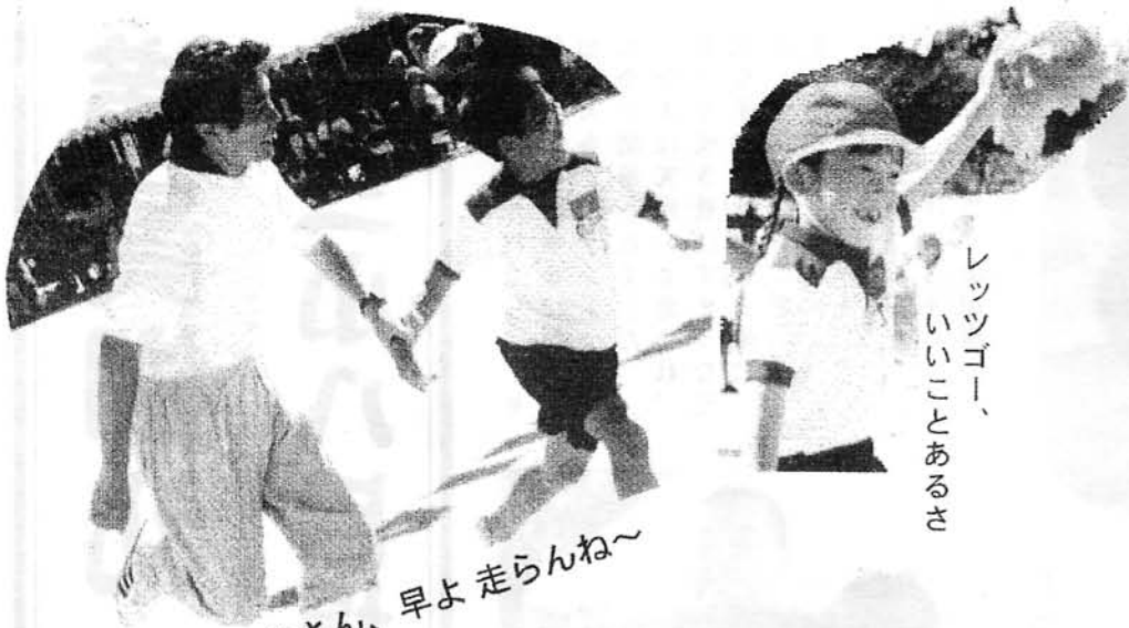
レッツゴー、 いいことあるさ