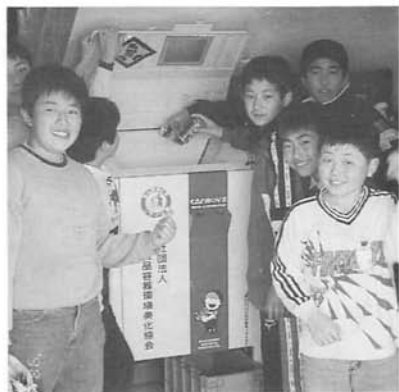
校内の空缶圧縮機「キャンボーイ」

これは、知らないところで我々社会も同じことをやっていることなのです。 数年前、テレビ番組で紹介された『ナタ、デ、ココ』が、低カロリーで体にいいと、日本では爆発的なブームになり、飛ぶように売れ、品切れの店も出るくらいでした。しかし、その裏では、ココナッツを精製する際に出る有毒の廃液が日本では流せないで東南アジアの国の、もちろん浄化設備もない町工場みたくなところで製造されて、その廃液で現地の水が急激な勢いで汚染されている様子が報道されておりました。 これもまた、「売れさえすれば、自分が飲む水でなければ」ということなのでしょうか？