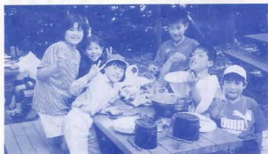
宿泊体験学習(5年生) 6/4~5