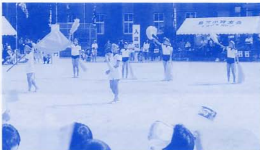
ウーロン茶ウツ ゲンマイ茶ゲツ……