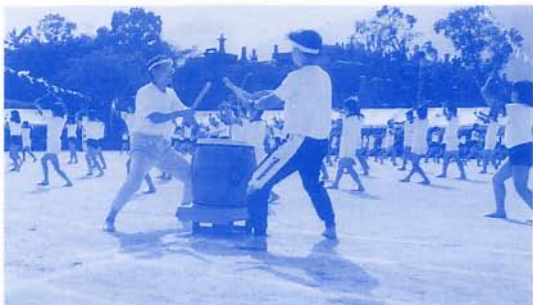
リズム だいしょうぶ?