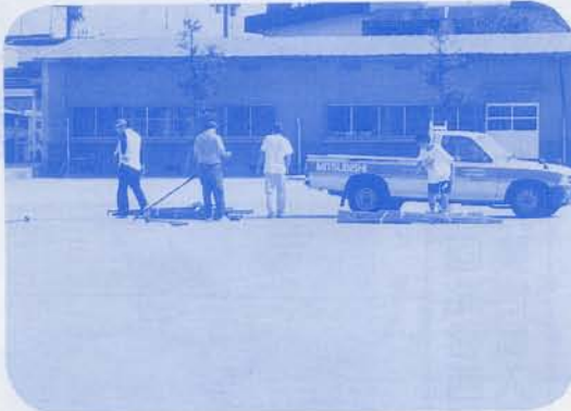
ドラゴンボール大会準備 9/9