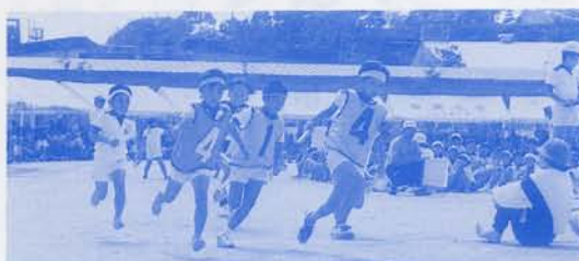
夢は九州一周駅伝？