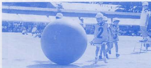
ありさん どこ行くの？