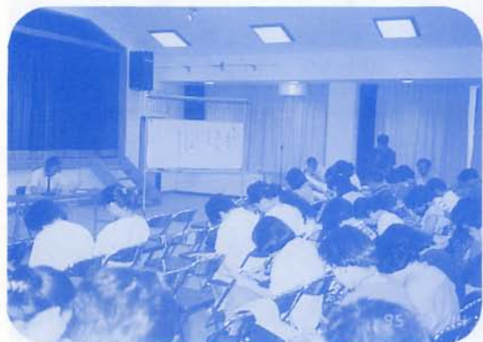
代議員研修会「夏休みについて」 7/14