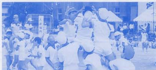
取られても泣きません