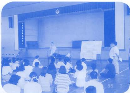
リーダー研修会「救急法講習会」 7/8