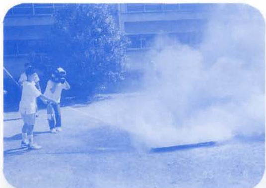
リーダー研修会「消火訓練」 7/8