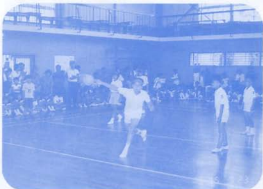
町内対抗ドッチボール大会 7/23