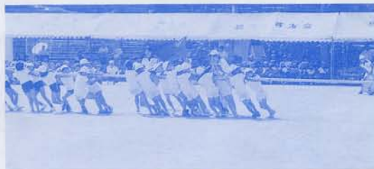
そ～れ引け ヨイショ！