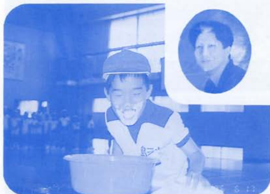
学年レクリエーション（5年） 6/18