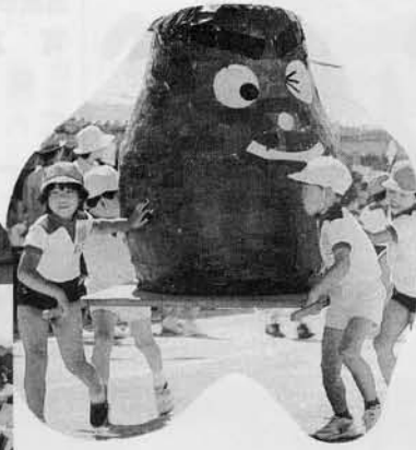
ガンバレ. ガンバレ