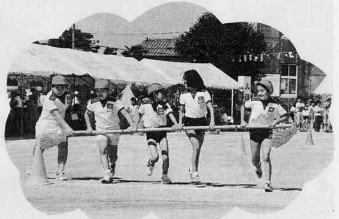
チームワークで1番!