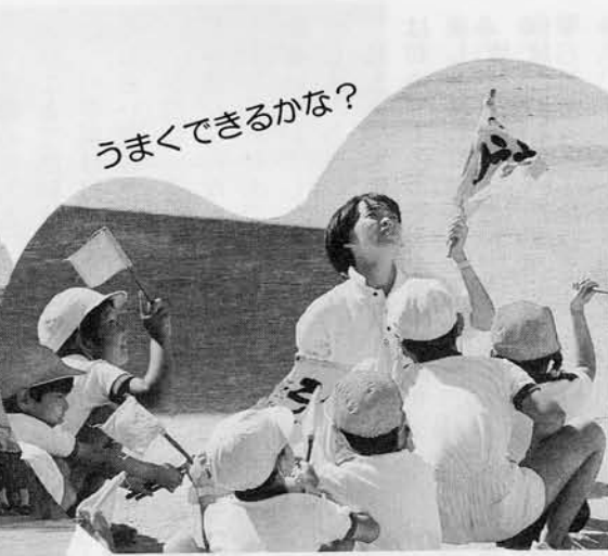
うまくできるかな?