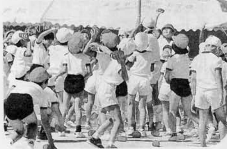
赤勝て。青勝て。黄勝て!