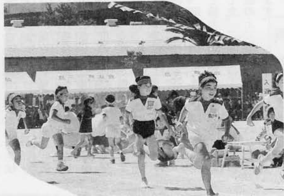
元気いっぱい 走れ走れ