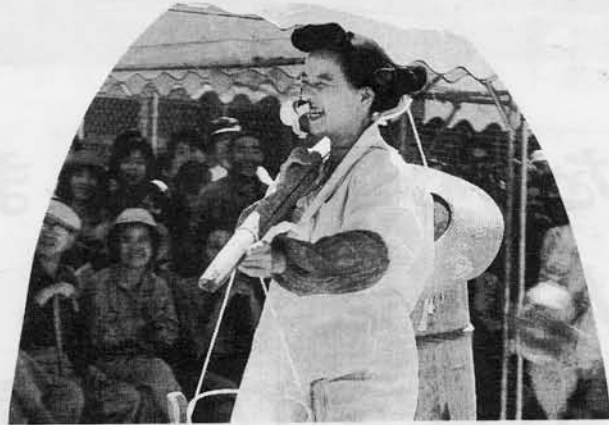
かわいいかな? くさいかな?