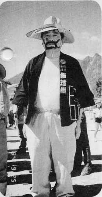
お山の大将 決まってるね!