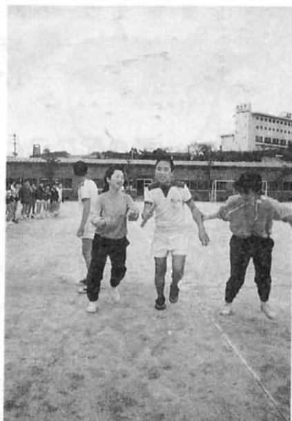
ヨッチャンもがんばりました