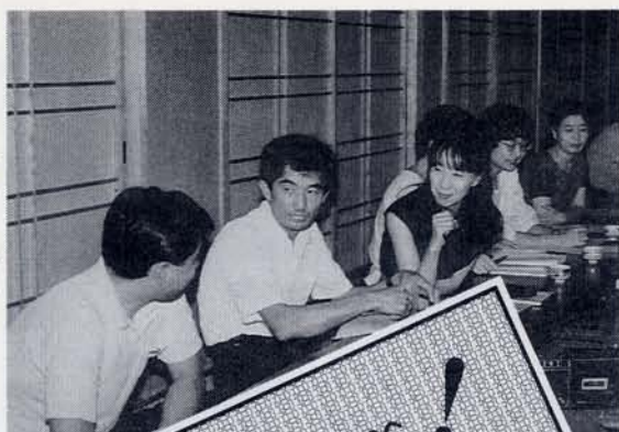
今年も勉強しました — 特殊教育座談会 —