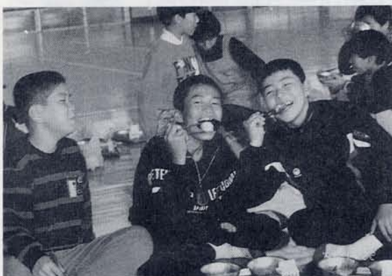
食べてる時がシアワセ…… — 6年生おにぎり大会 —