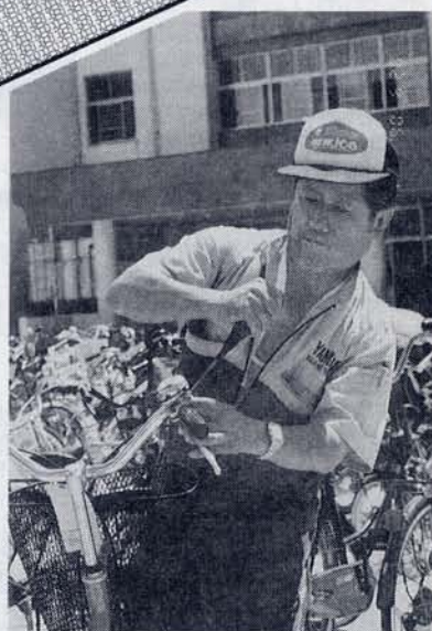
自転車店の御主人にも お世話になりました — 自転車点検 —