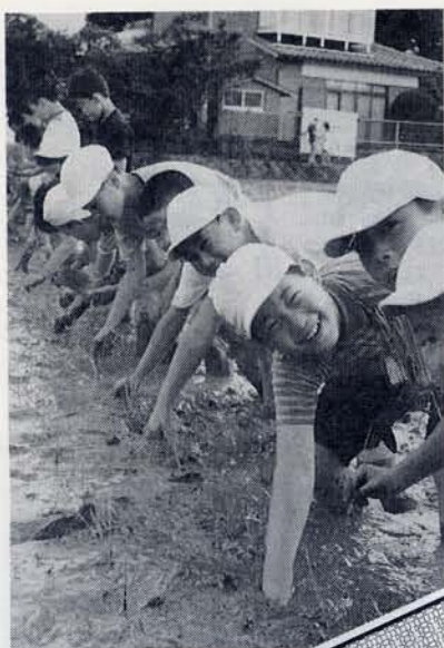
— 4年生の田植え — — ごらんください、この笑顔 —