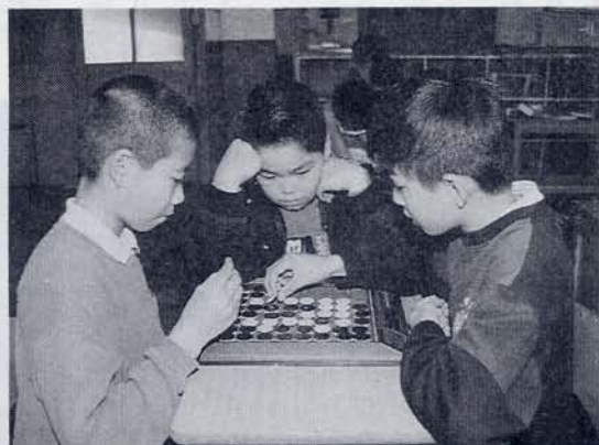
白熱………迷人戦？ — 将棋・オセロクラブ —