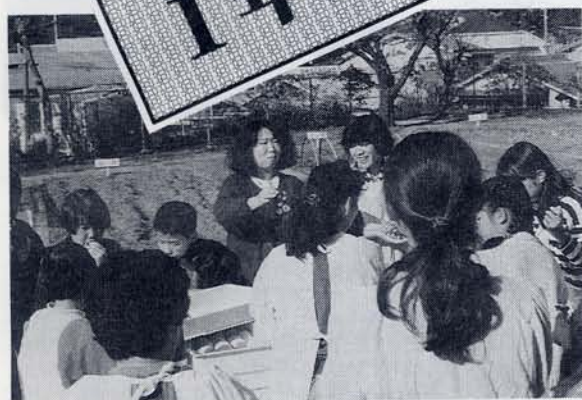
思わず力を込めてしまいました — もちつき大会 —