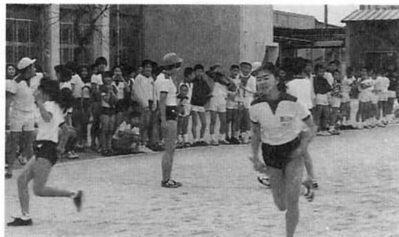
思い出の三小で、最後の全力疾走