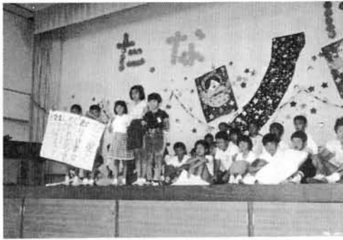
4年4組 たなばたクイズ

それぞれ、自分達の出し物のげき、歌、ねがい事発表、クイズ、色々あったけど、全部「七夕」に関する物ばかりでした。笑ったり感心したり、楽しい時間が過ぎました。七夕の日、毎年私は夜、空