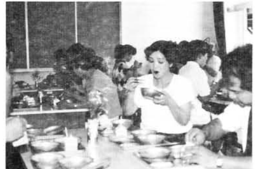
お味はいかがが……おいしいワ！

子供達の好きな献立は、学校・家庭ともカレーという答えが断然トップで、その他ハンバーグなど肉を使った料理が多く、このごろの子供達の