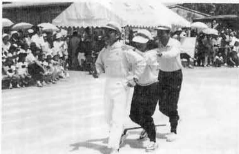
速そうに見えますが……