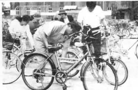
ここを修理しましょう