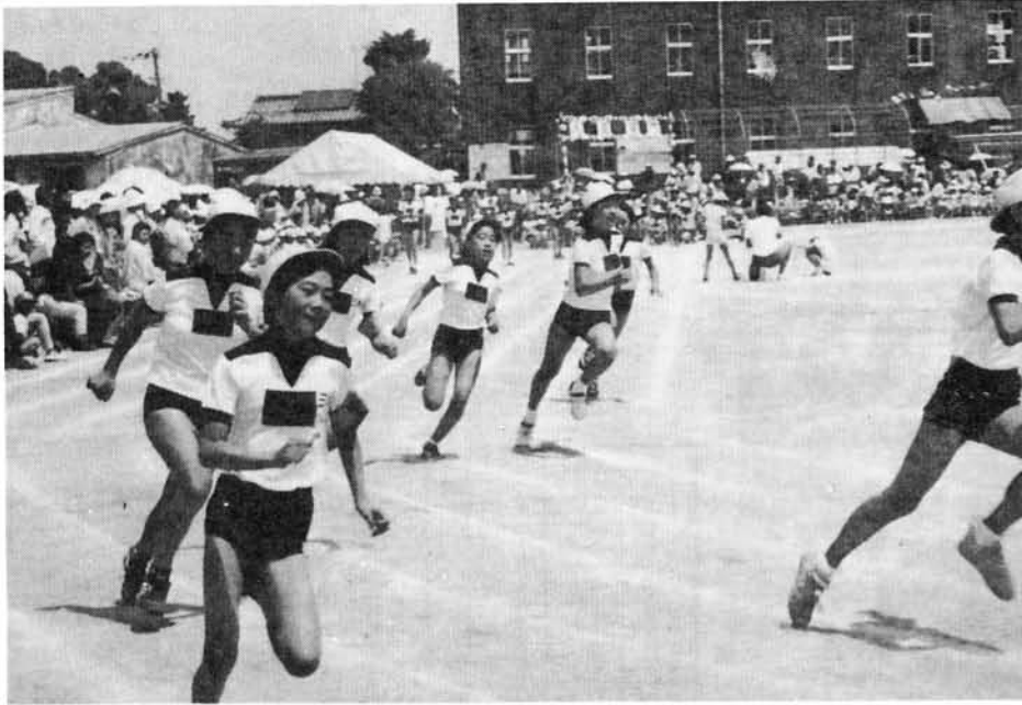
いっしょうけんめい走りました