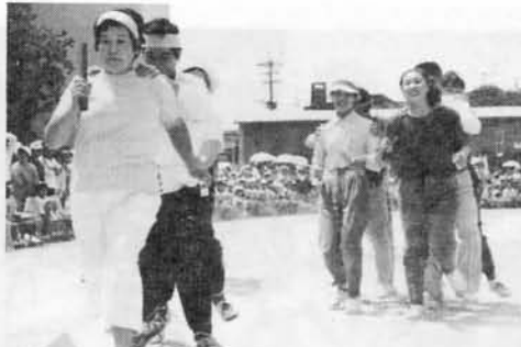
がんばるかあちゃん

た。でも、そのときピストルのおとがひどくて、一歩うしろにさがってしまいました。でも、一くみは二ばんでした。