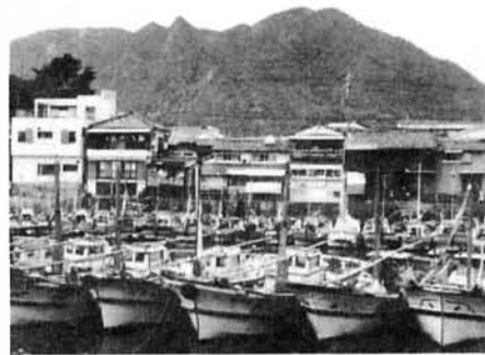
湊新地より見た中組内港

私が、育友会の仲間に入っ最初感じた事は、お父さん達の参加が本場に多いという事でした。現在は、残念ながら遊び場も時間も少なくなりました。子供達ばかりです。そんな中で、野外活動にとりくんでいる子供会の役割は大きいと思います。それには、やっぱりお父さん達の協力がいかに大切であるか！ではないでしょうか。(もちろんお母さん達もです)子供達にとっての大切な一年間、できるだけいい思い出が残るよう、有意義な一年でありますように、育友会の一員として見守っていききたいと思っています。